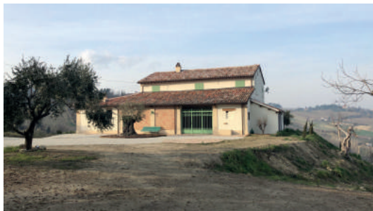
Sede del corso: Via Saiano, 502 - 47521 Cesena