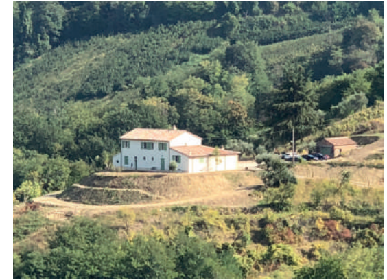
Sede del corso: Via Saiano, 502 - 47521 Cesena