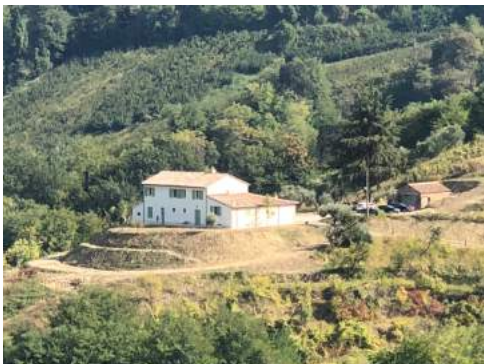
Sede del corso: Via Saiano 502, 47521 Cesena

Medico chirurgo, specialista in odontostomatologia master in posturologia presso l'università di Pisa. Perfezionato in ortodonzia Invisalign presso l'Università di Varese. Direttore del laboratorio posturale OP in Reggio Emilia presso il quale Eptamed testa posturalmente i propri equilibratori e dalla collaborazione è nato anche il modello Genius. Primo in Italia, ha sperimentato e pubblicato, come associare dispositivi funzionali a tecniche ortodontiche quali allineatori e minitubes (OP system).