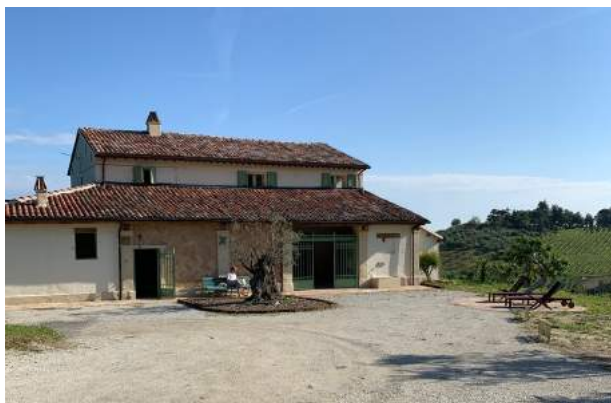
Sede del corso: Via Saiano, 502 - 47521 Cesena

La rivista scientifica PNEI Review ha pubblicato un suo articolo che ribalta le credenze attuali sull'origine della carie.