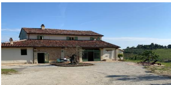
Sede del corso: Via Saiano, 502 Cesena - FC