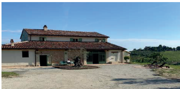
Sede del corso: Via Saiano, 502 Cesena - FC