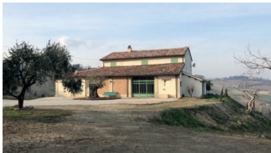
Sede del corso: Via Saiano, 502 - 47521 Cesena