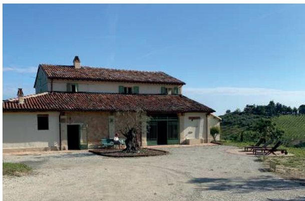
Sede del corso: Via Saiano, 502 Cesena - FC

Medico chirurgo, specialista in odontostomatologia master in posturologia presso l'università di Pisa. Perfezionato in ortodonzia Invisalign presso l'Università di Varese. Direttore del laboratorio posturale OP in Reggio Emilia presso il quale Eptamed testa posturalmente i propri equilibratori e dalla collaborazione è nato anche il modello Genius. Primo in Italia, ha sperimentato e pubblicato, come associare dispositivi funzionali a tecniche ortodontiche quali allineatori e minitubes (OP system).