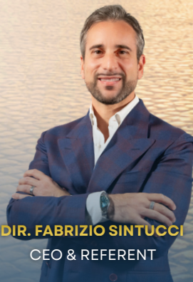
DIR. FABRIZIO SINTUCCI CEO & REFERENT