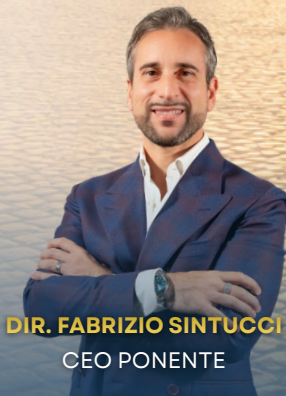
DIR. FABRIZIO SINTUCCI CEO PONENTE